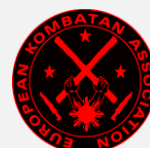
EUROOPAN KOMBATAN LOGO V. 2016 ->